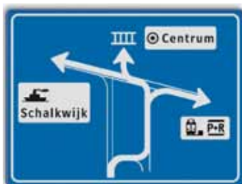
dit bord komt op de Wethouder Schoutenweg