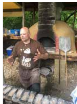
Oesterzwammen op koffiedik en Brood Leeft in het OndernemersLab